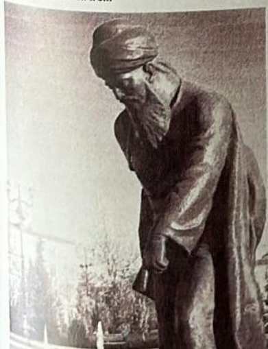
La statue d'Al Suli en Iran.

Dans ma longue carrière de joueur amateur (il faut bien le souligner) qui couvre plus de 50 ans de passion échiquéenne et d'investissement personnel, notamment au sein de mon club "Alwan Fannia" et en équipe nationale, il y a eu forcément des moments d'intensité, de joie, de déception et de bonheur. Notre mémoire recèle de nombreux souvenirs inoubliables, le choix est difficile. Cependant, je ne pourrais guère oublier ma dernière partie de championnat individuel du Maroc (Casablanca, décembre 1982) alors que, sévèrement grippé, je devais concrétiser une partie difficile face à un adversaire coriace. Elle dura plus de 9 heures avec trois ajournements. Toute l'assistance dut attendre pour voir la conclusion me permettant de remporter mon premier titre de champion du Maroc.